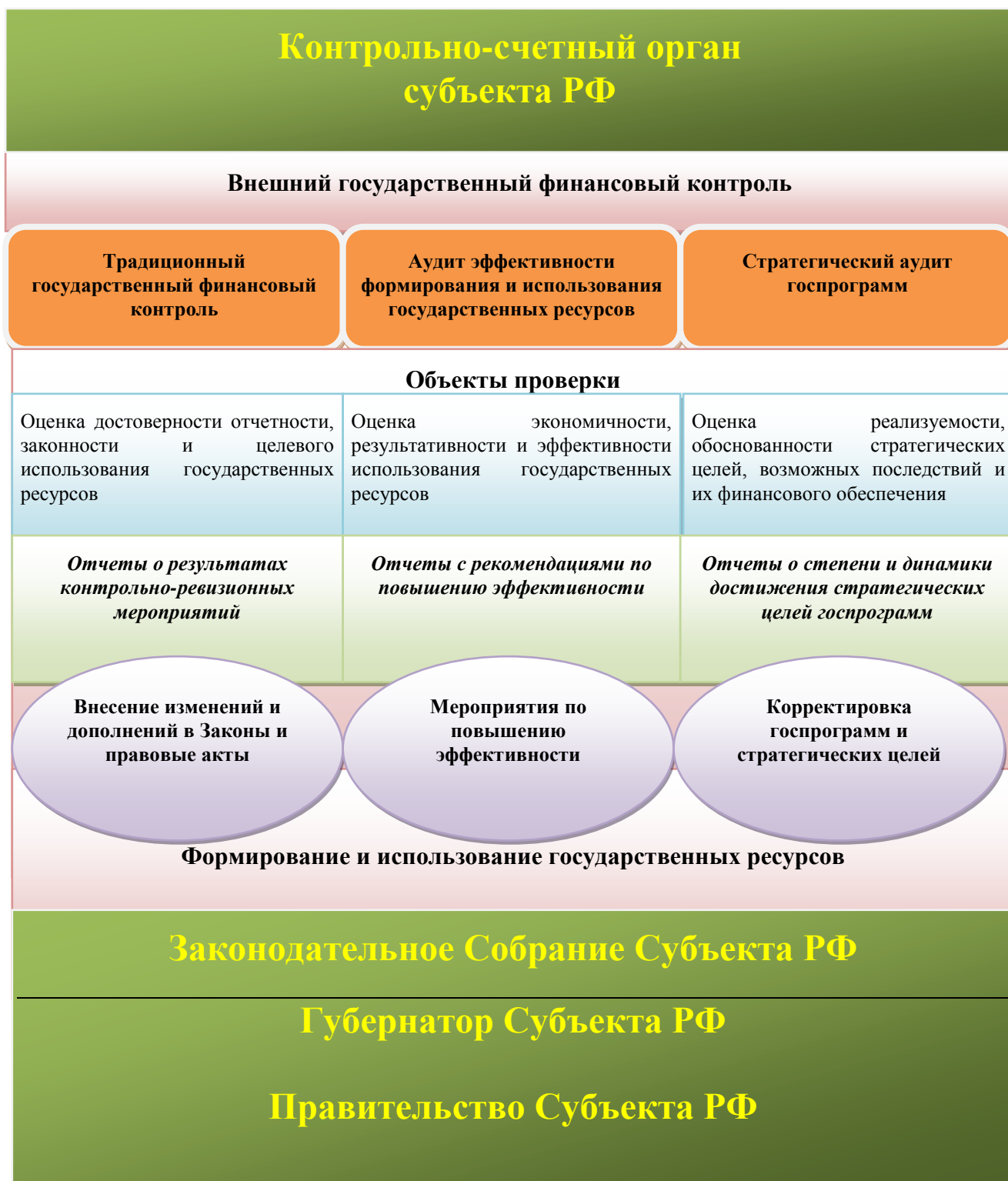
Рис. 1. Система внешнего государственного финансового контроля на уровне субъекта РФ